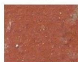
Tuiles Ocre Rouge